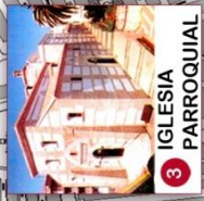
3 IGLESIA PARROQUIAL