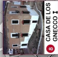
8 CASA DE LOS GNECCO I