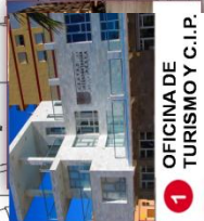
1 OFICINA DE TURISMO Y C.I.P.