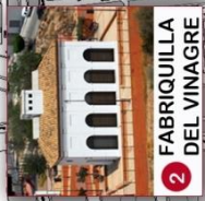
2 FABRIQUILLA DEL VINAGRE