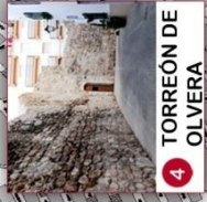
4 TORREÓN DE OLVERA