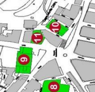
9 CASA DE LOS GNECCO II