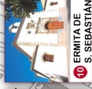
10 ERMITA DE S. SEBASTIÁN