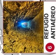
6 REFUGIO ANTIAÉREO