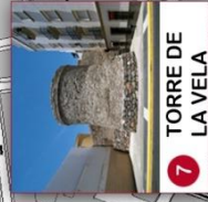
7 TORRE DE LA VELA